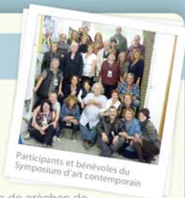
Participants et bénévoles du Symposium d'art contemporain