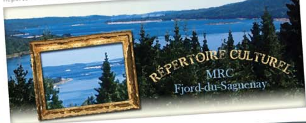
Répertoire culturel Internet

La Municipalité régionale de comté (MRC) du Fjord-du-Saguenay regroupe 13 municipalités et administre trois territoires non organisés. Elle offre différents services aux communautés rurales, notamment en aménagement du territoire, et prend part au développement culturel et à la mise en valeur du patrimoine par l'entremise de sa politique culturelle. Visitez le répertoire culturel : www.mrc-fjord.qc.ca/repertoireculturel