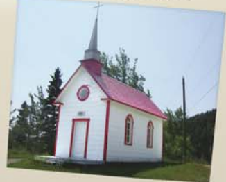
Chapelle de Saint-Basile-de-Tableau