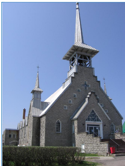
L'Église Saint-Félix, lauréate de l'édition 2014 des Prix du patrimoine de la MRC.

Ce projet est réalisé grâce à une contribution financière de l'Entente de développement culturel intervenue entre la MRC et le ministère de la Culture et des Communications (MCC).