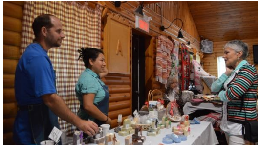
Les Journées de la culture dans le Bas-Saguenay.