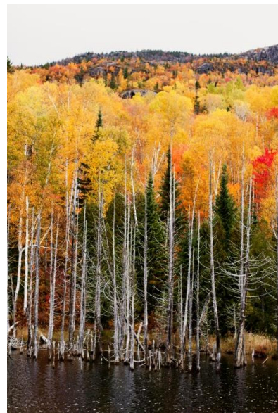
Parc national des Monts-Valin