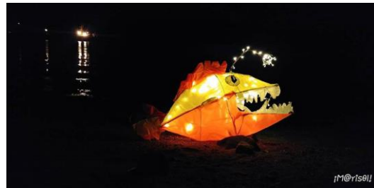
Poisson-lanterne, oeuvre collective conçue à Sainte-Rose-du-Nord pour les Journées de la culture