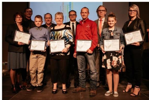
Les lauréats de cette troisième édition de la Reconnaissance des bénévoles de la MRC

Pour déterminer les lauréats, un comité de sélection a analysé les dossiers selon quatre critères : l'engagement personnel et social, la détermination et la motivation, la reconnaissance du milieu et l'innovation communautaire.