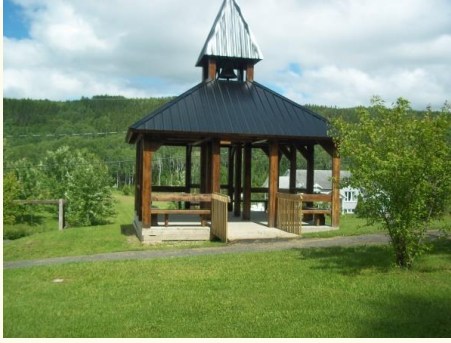
Abri de la cloche de l'église Sainte-Bernadette